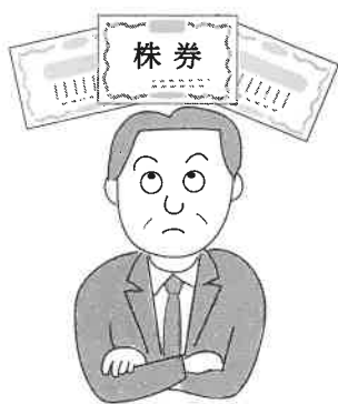
図1 個人・発行法人以外の法人に対する非上場株式の譲渡

例えば、時価が3000万円の自社株を5000万円で売却した場合、売却額と時価との差額の2000万円は、買主から売主への贈与となります（次頁表参照）。